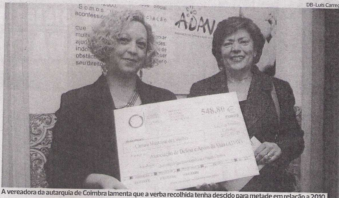
A vereadora da autarquia de Coimbra lamenta que a verba recolhida tenha descido para metade em relação a 2010